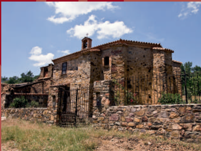
Hospital del Obispo