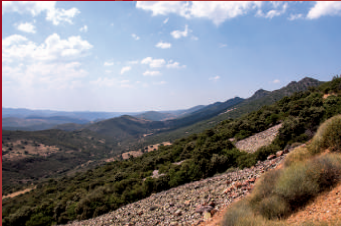
Sierra de Altamira

En el recorrido, sobre todo en las zonas serranas, abundan ciervos ( Cervus elaphus ) y corzos ( Capreolus capreolus ) y se pueden observar halcones peregrinos ( Falco peregrinus ), alimochos ( Neophron percnopterus ) y aves forestales como el arrendajo ( Garrulus glandarius ), ruiseñor común ( Luscinia megarhynchos ), trepador azul ( Sitta europaea ), etc.